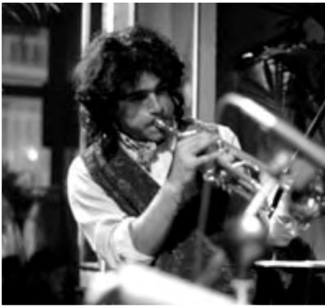
PAOLO FRESU, 1992