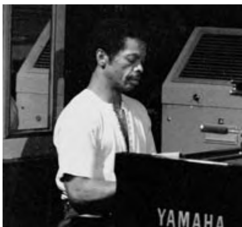
DON PULLEN, 1988