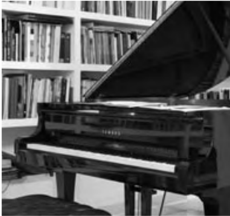
EL PIANO DEL CENTRAL, 2009