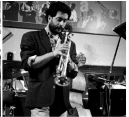
FLAVIO BOLTRO, 1991