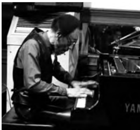
SAM RIVERS, 1991