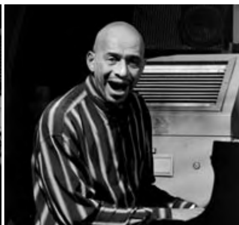
KIRK LIGHTSEY, 1992