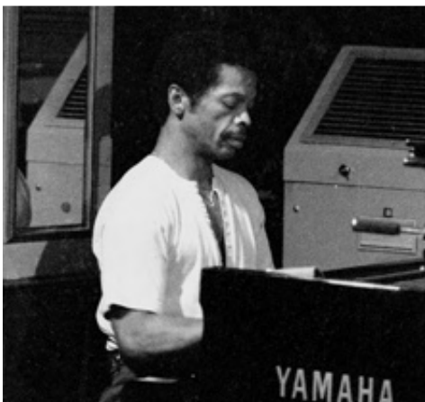
DON PULLEN, 1988