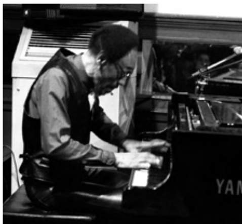
SAM RIVERS, 1991