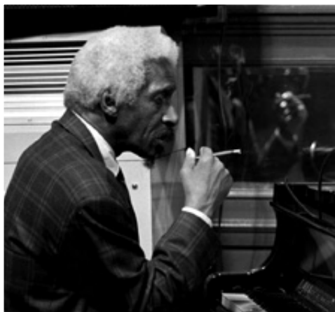
MAL WALDRON, 1992