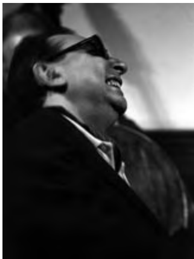
TETE MONTOLIU, 1993