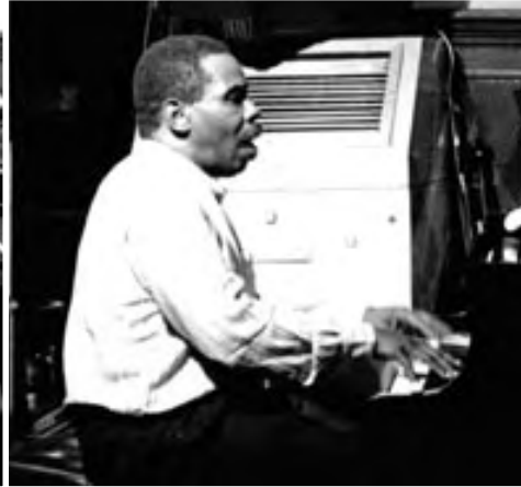
GEORGE CABLES, 1994