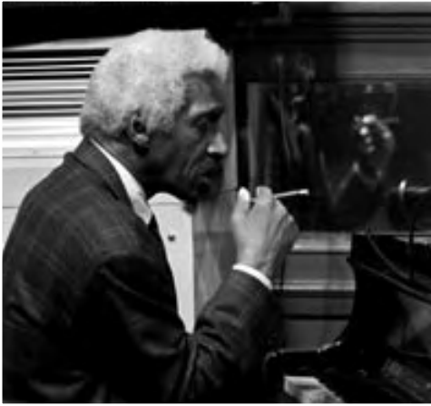
MAL WALDRON, 1992