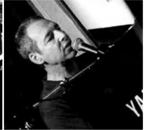
BEN SIDRAN, 1998.

Three legs, 246 strings, 88 keys, two tops, three pedals, and so on. Most pianos have the same type of equipment, but each has its own biography. This book tells the story of 4510762, a Yamaha C3 born in Japan in 1988. It spend twenty years at the Café Central in Madrid, making jazz in the hands of great masters like Don Pullen, Randy Weston, Tete Montoliu, Ben Sidran, Larry Willis, David Kikoski, Albert Bover, Mal Waldron, Brad Mehldau, Kirk Lightsey, George Cables, Barry Harris and Chano Domínguez. Finally, in 2008, it left the Café Central and wound up in a bourgeois house whose owners had no idea it had lived such an adventurous life. Chance and the infinite devotion of a jazz-lover from Madrid rescued it, which was a relief for the piano, and for many admirers who remember it fondly. This rescue was itself a paradoxical task, but its importance pales in the presence of the musical events we will be narrating. Reconnoitering the non-sonic surroundings of the jazz that came out of this instrument is so far from the ultimate meaning of the music—purely empirical and temporal—that it may be close to perverting it. But no. Moreover, the book contains a CD in which the piano sings again, outside its original context, but in the hands of some of the artists who played it at the Café Central.