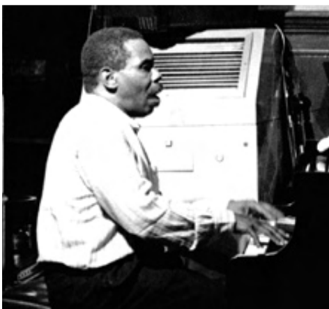
GEORGE CABLES, 1994