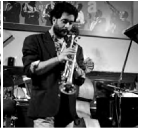
FLAVIO BOLTRO, 1991