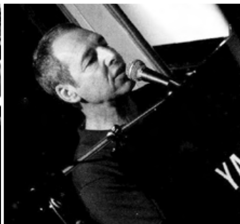
BEN SIDRAN, 1998.

3本の足、246本の弦、88個の鍵盤、ふたつの蓋に三つのペダル.....多くのピアノは同じ構造をしていても、それぞれが違った人生を辿るものだ。この本は1988年に日本で生まれたヤマハC3、製造番号4.510.762の物語をつづったものである。このピアノは、マドリードのジャズクラブ『カフェ・セントラル』で、多くのマエストロ達の手にかかってきた。ドン・プーレン、ランディ・ウェストン、テテ・モントリュー、マル・ウォルドロン、ブラッド・メルドー、ラリー・ウイリス、ベン・シドラン、カーク・ライトシー、ジョージ・ケーブル、バリー・ハリス、イニャキ・サルバドール、ダビット・キコスキ、アルベルト・ボヴェール、マリアノ・ディアス、チャノ・ドミンゲスといった世界的アーティストたちがこの鍵盤に手を置いた。ピアノは2008年にこのローカルを出て、その歴史に疎いとある中流階級の家にとどりつく。偶然と、一人のマドリレーニョのジャズへの無限の崇拜が、ピアノの平穩のために動いた。そしてこの掘り起こした物語は、愛好家たちの思い出を助けることとなった。この救出の物語は、パラドックスにあふれ、このピアノが弾いてきた音楽的価値に比べたら些細なものかもしれない。ピアノが供にしたジャズにまつわる、音とは最もかけ離れた物語をつづることは、音楽にとは最も遠い作業かもしれない。純粋に経験的で一過性のものかもしれない。だからこそ、この本には読者を音楽へ引き戻すCDが付録されている。カフェでの生録音とは異なるが、カフェ・セントラルで演奏したアーティストたちの手による録音はこのピアノとその物語を見事に蘇生する。