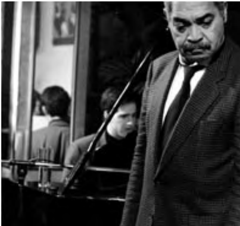
ART FARMER & BERNARDO SASSETTI, 1994