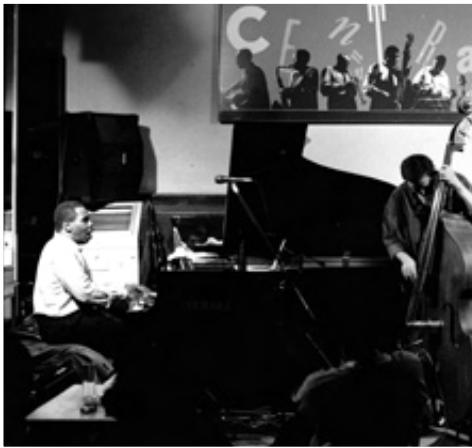
GEORGE CABLES TRIO, 1994