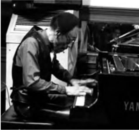
SAM RIVERS, 1991