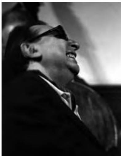
TETE MONTOLIU, 1993