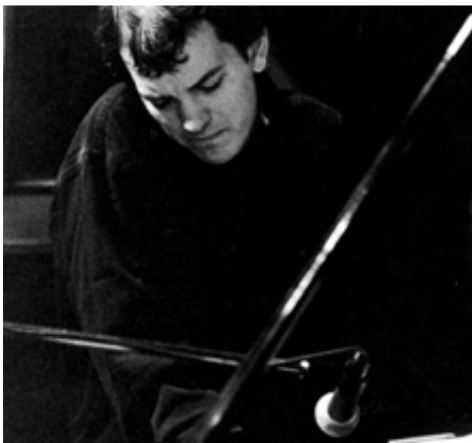
BRAD MEHLDAU, 1994.