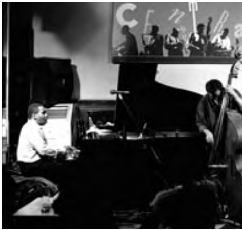
GEORGE CABLES TRIO, 1994