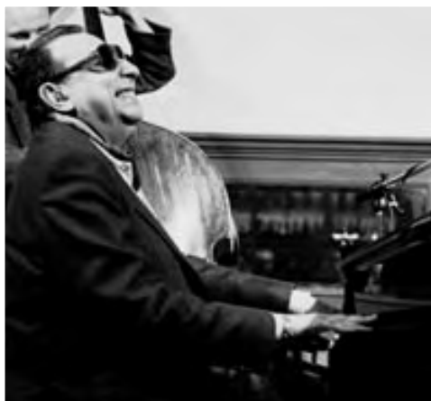
TETE MONTOLIU, 1993