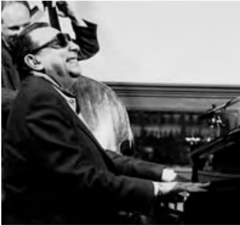
TETE MONTOLIU, 1993