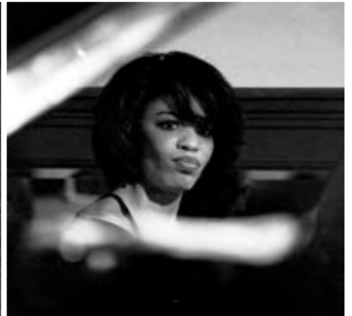
CINDY BLACKMAN, 1989