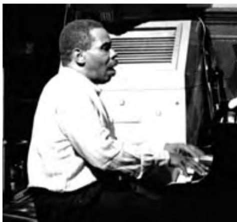
GEORGE CABLES, 1994