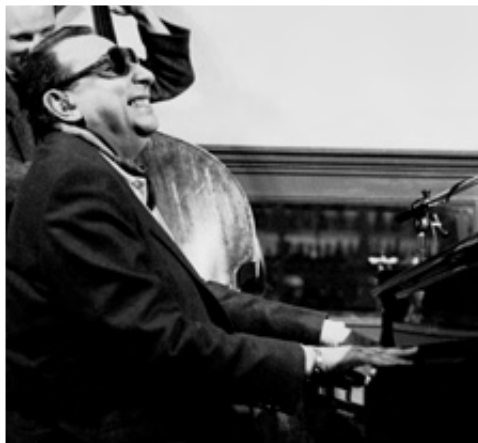
TETE MONTOLIU, 1993