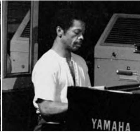
DON PULLEN, 1988