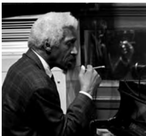
MAL WALDRON, 1992