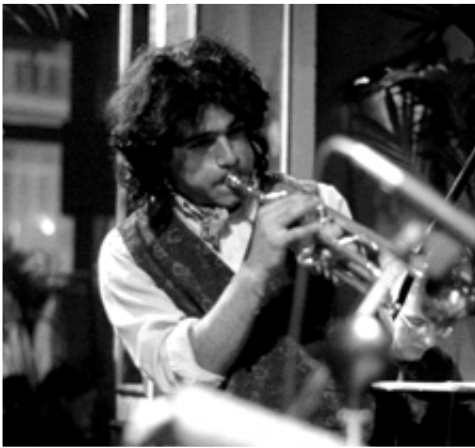
PAOLO FRESU, 1992