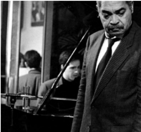
ART FARMER & BERNARDO SASSETTI, 1994