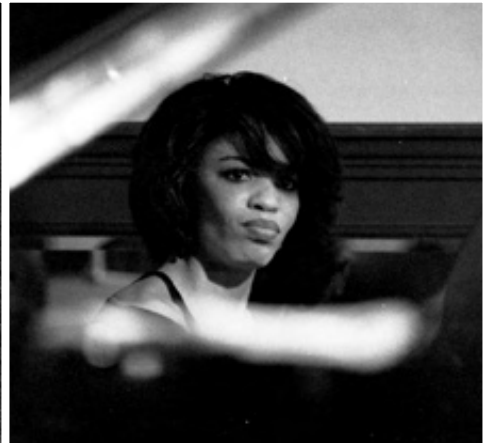
CINDY BLACKMAN, 1989