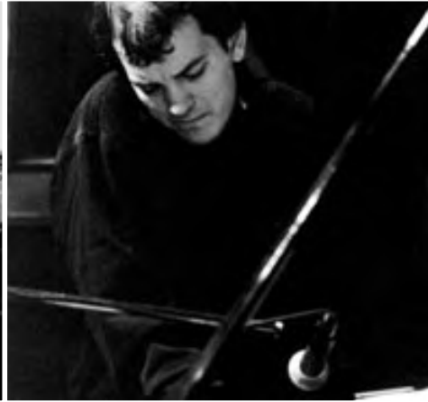
BRAD MEHLDAU, 1994.