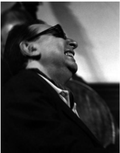
TETE MONTOLIU, 1993

だけ叩かれたのかを計算することもできる。たとえば、コンサートに欠かせないブルース。12のコンパスが32コーラス続き、メインテーマに入るとして、二人のミュージシャンがそれぞれ15コーラスずつ弾くとする。ピアニストは異なったボーイングにあわせて、ソーホットやブロックコードを奏でてゆく。たとえば、4音ごとに上がってゆくというように。一和音につき5音を使うとして、1コンパスにつき4回の繰り返し。8分音符をふんだんに加えることもあれば、その早さによってもその数は増える。1コンパスで30回ピアノを叩くとして、一曲につき11520回の計算。たとえば一晩で8曲演奏するならば、20万回鍵盤が叩かれることになる。数を見れば、ピアノの調音・調律がしばしば必要になることがわかる。構造だけでなく、調音、調律、弦の張替えなどなど……。「乗り続けて」ゆくには音のまとまりも、鍵盤の正しい感覚も必要だ。こうして、プロフェッショナルの登場となる。アーティストであり、職人でもあり、セントラルのピアノの世話をしていたのがエドワード・ムニョスだ。彼は何年にも渡ってセントラルのピアノを診てきた。調音師4代目の彼の家族がピアノの調律を始めたのが1860年。エドワードは父に学び、国際的な学校で学んだ後、ハンゼン・ヤマハで働き、独立するに至った。スペインにやってきた著名なピアニストのピアノを準備し続けてきた彼。90年代には、スヴァトスラフ・リヒテルのスペインツアーをサポートし、マドリードのジャズフェスティバルの調音調律も手がける。クラブ・デ・ムジカや、ジャズ・サン・ファン・エバンヘリスタも彼のテリトリーだ。この章では、セントラルのピアノが辿った、酷使されたピアノの状態をはじめ、再生までの修理、数々の調整などを通し一台が救われた姿を明らかにしてゆく。