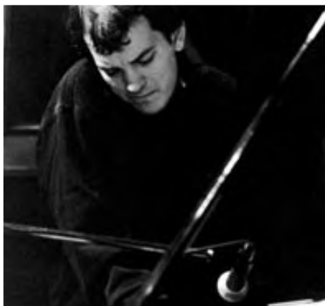
BRAD MEHLDAU, 1994. © PHOTO MERCEDES RODRÍGUEZ